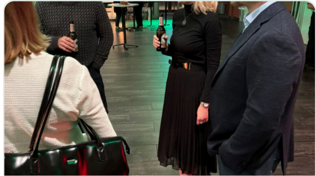
Austausch im Mittelpunkt

Viele interessante Gespräche prägten den Abend.