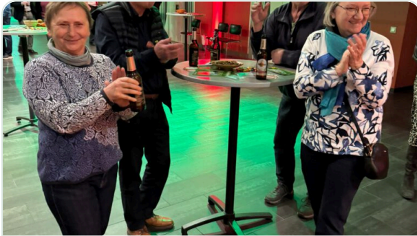
Politik im Gespräch

Ich habe mich sehr gefreut, an diesem Abend auch selbst einige Gedanken zur Kommunalpolitik und zum Wahlkampfendspurt teilen zu dürfen.